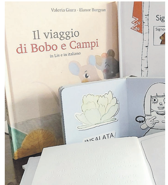
EDITORIA ACCESSIBILE Libri senza barriere

È liberamente accessibile, anche da parte di famiglie, sco-