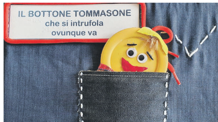
TOCCARE PER VEDERE Un libro tattile per l'infanzia

laresche, docenti, bibliotecari, librai, educatori, previa prenotazione tramite mail a leggere2mari@gmail.com oppure telefonando al 350/0803963.