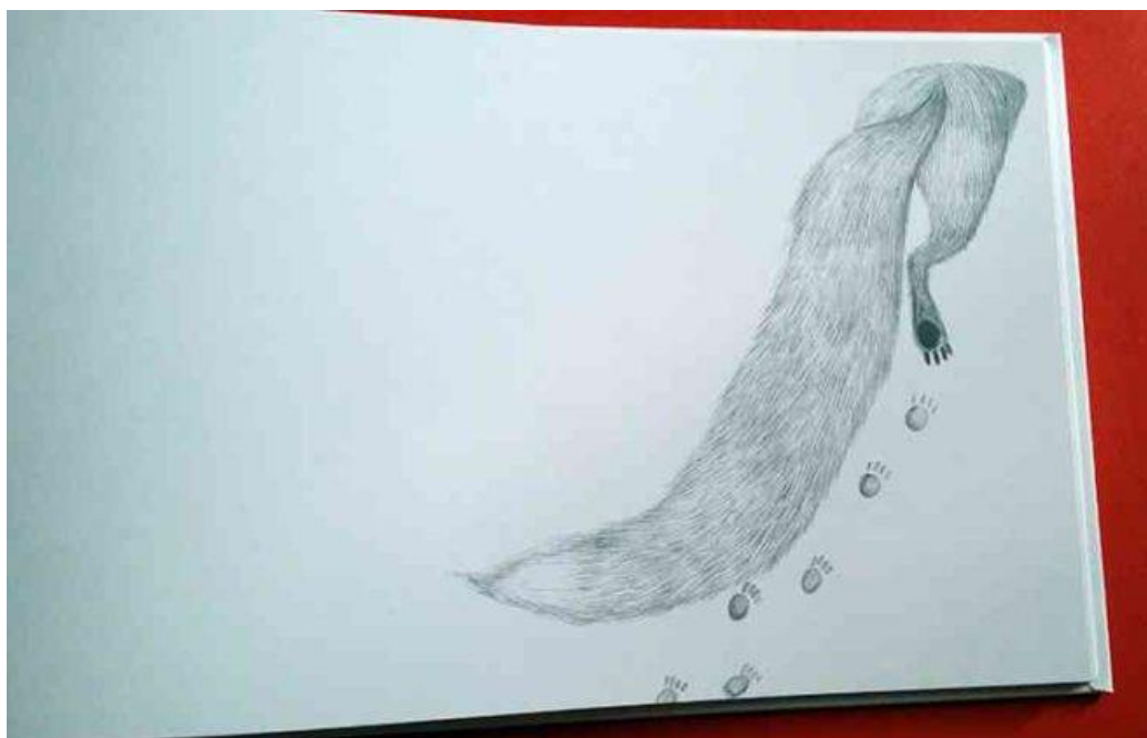
di Luisa Carretti, illustrazioni e grafica di Barbara Lachi, Storie Cucite, 2016