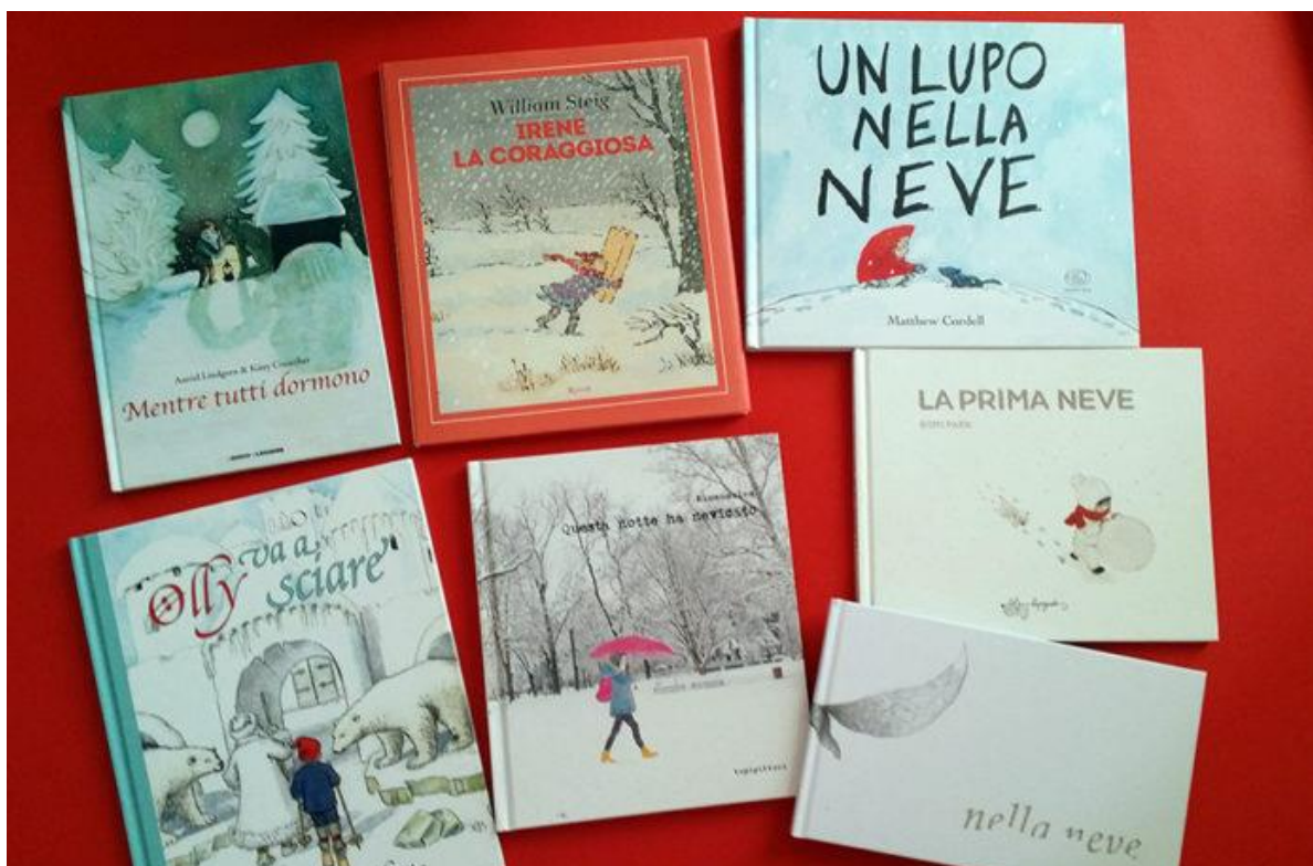
Storie di neve per bambini selezionate da Milkbook

E mentre la neve bussa alla porta e il vento gelido spettina l'Italia da Nord a Sud, noi ci immergiamo ancor più nell' atmosfera invernale tirando fuori dallo scaffale albi illustrati ammantati di neve e luce.